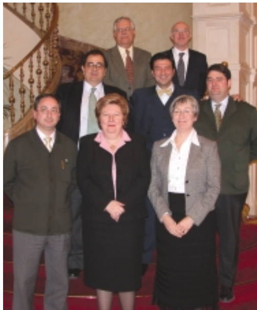
Miembros del jurado del Premio.

La Asociación Española de Profesionales de Turismo (AEPT), creada en el año 1969 ha logrado aglutinar a los principales profesionales del sector de todos sus ámbitos para convertirse en su voz poderosa, objetiva e independiente. www.aept.org