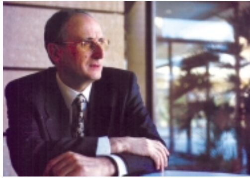
Germán Porras Olalla, Secretario General de Turismo