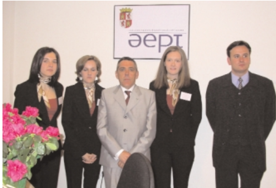
El equipo de la AEPT en Soria