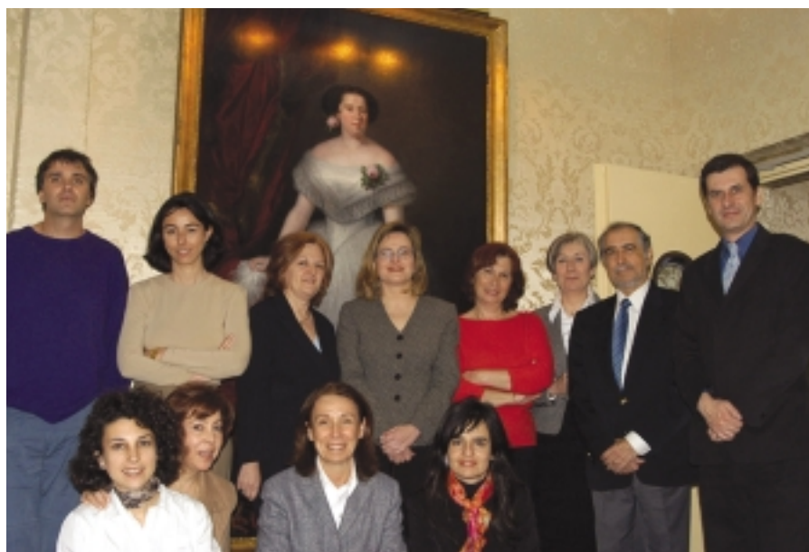
Los miembros del jurado

Turismo de Andalucía, la Oficina de Turismo de Bélgica y el Restaurante Contraste del Hotel Intercontinental Princesa Sofía de Barcelona fueron los otros candidatos.