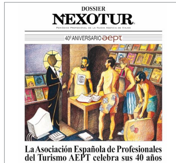
La Asociación Española de Profesionales del Turismo AEPT celebra sus 40 años